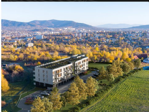
Apartamenty na Szczycie 3 Lipiek w Bielsku-Białej